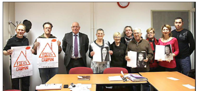
■ Les acteurs de la semaine EFA se sont rencontrés à la Maison de la vie associative pour présenter leurs actions.

Le 3 avril, pour l'inauguration de la semaine EFA, le livre sera présenté au centre culturel Jean-l'Hôte avec la présence de plusieurs personnes qui ont témoigné dans le livre.