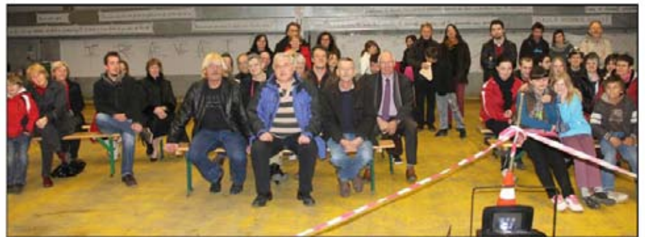
■ Les participants de « Sans danger... Travail » réunis au marché couvert transformé en hall d'exposition.

Vendredi soir, c'est par une fête sous le marché couvert que l'association Focus Carmin a terminé son action à Neuves-Maisons. Les jeunes inscrits à la mission locale de l'emploi et les résidents du foyer Aristide-Briand, les travailleurs de l'association de réinsertion de l'atelier du Savoir Fer, des collégiens de Jules-Ferry et plusieurs utilisateurs de la maison de la vie associative étaient présents.