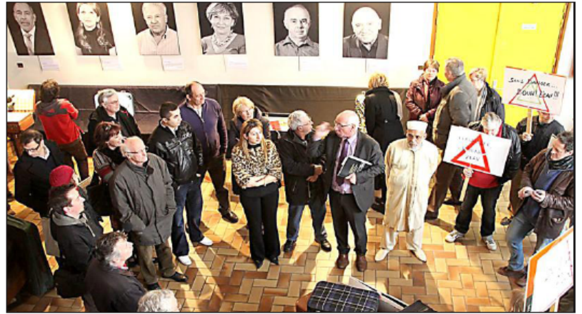
■ A tour de rôle, chaque représentant a pris la parole afin de présenter son travail.

rie de portraits tirés du livre « 54, Être humain, Racontons notre histoire » était accrochée sur un pan de mur. Plusieurs personnes ayant témoigné étaient présentes à l'inauguration. Il y avait aussi l'association Oasis-France-Maroc, le Secours catholique et l'association CLCV qui avaient chacune un stand pour présenter leur travail quotidien. A tour de rôle, chaque représentant a pris la parole afin de présenter son travail pour accompagner à leurs manières le projet « Egalité, fraternité : Agissez ». Pendant encore sept jours, le hall du centre culturel Jean L'Hôte restera ouvert au public pour la semaine EFA qui durera jusqu'au 12 avril.