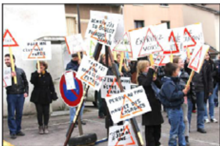
■ Les participants de l'action « Sans danger... Travail » se sont réunis à Neuves-Maisons pour une action symbolique