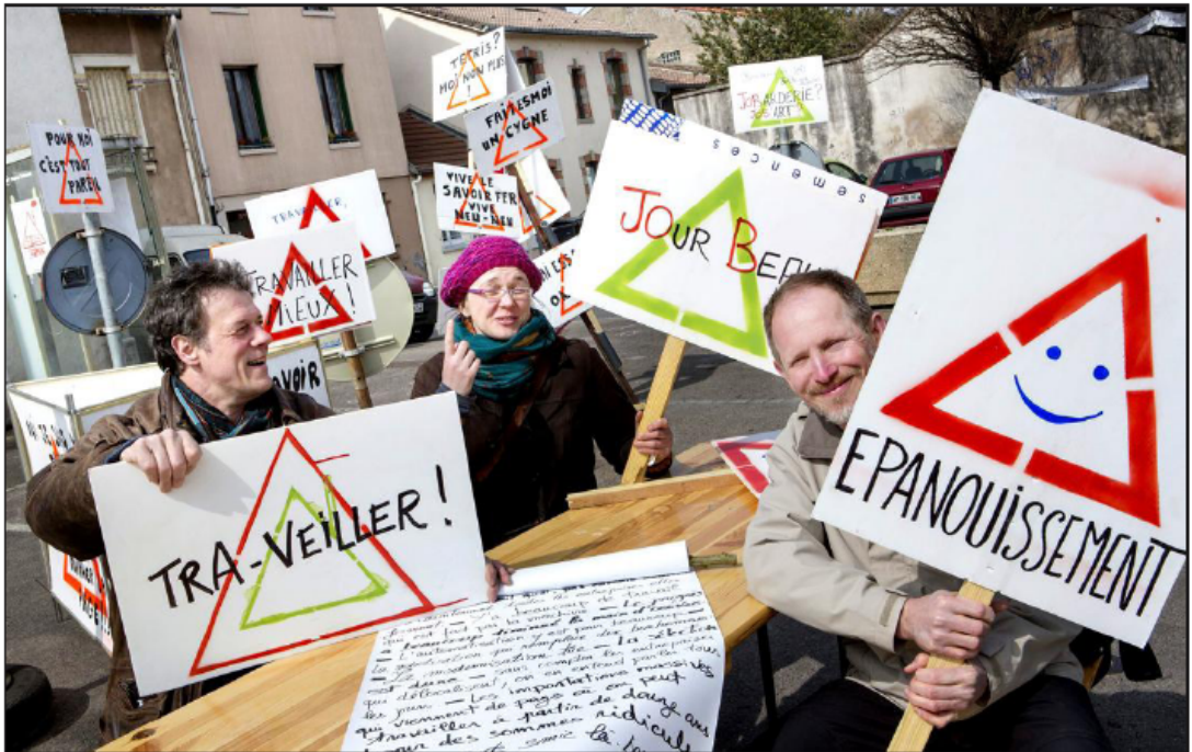
■ L'heure est à la revendication artistique, à la manifestation ludique et « laborieuse », à l'expression autour du boulot.

C'est tout bête, un dialogue qui s'amorce. Mais il y en a eu vingt comme ça, cent ou cinq cents même depuis l'arrivée de Man'Ok dans la ville à la rentrée dernière. Parfois aussi spontanés, mais souvent sollicités par la