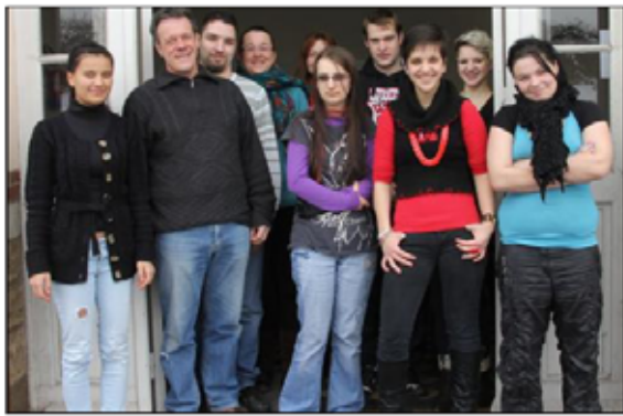
■ L'ambiance est toujours dynamique et conviviale au sein de l'atelier.